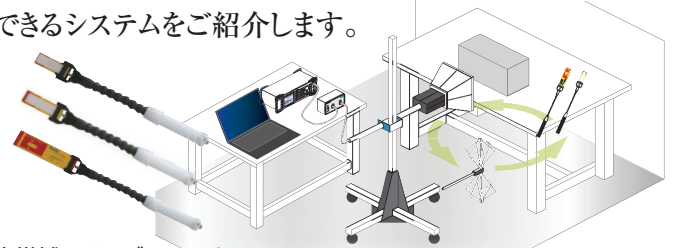
広帯域スリーブアンテナ NKU Series

近接試験用の小型パワーアンプと信号発生器、高効率な近接試験用のアンテナを使用することで、シールドルーム内にて、簡易的にRF放射イミュニティ試験の事前評価ができるシステムをご紹介します。