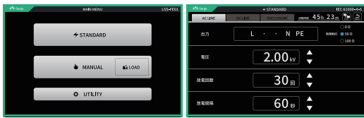
雷サージ試験器 LSS-FE01 Series