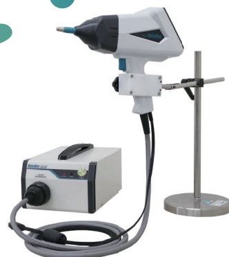
静電気試験器 ESS-PS1 & GT-31S