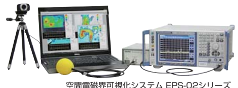
空間電磁界可視化システム EPS-02シリーズ